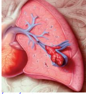
Huyết khối gây nghẽn mạch phổi