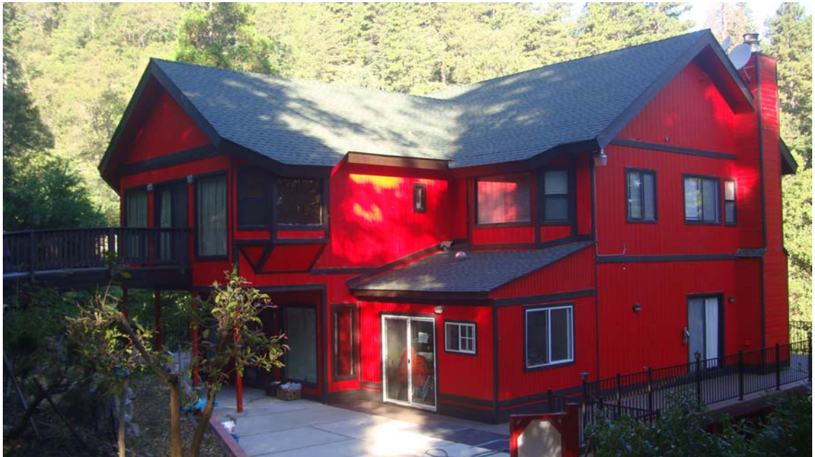
Mặt sau của Thiền Viện