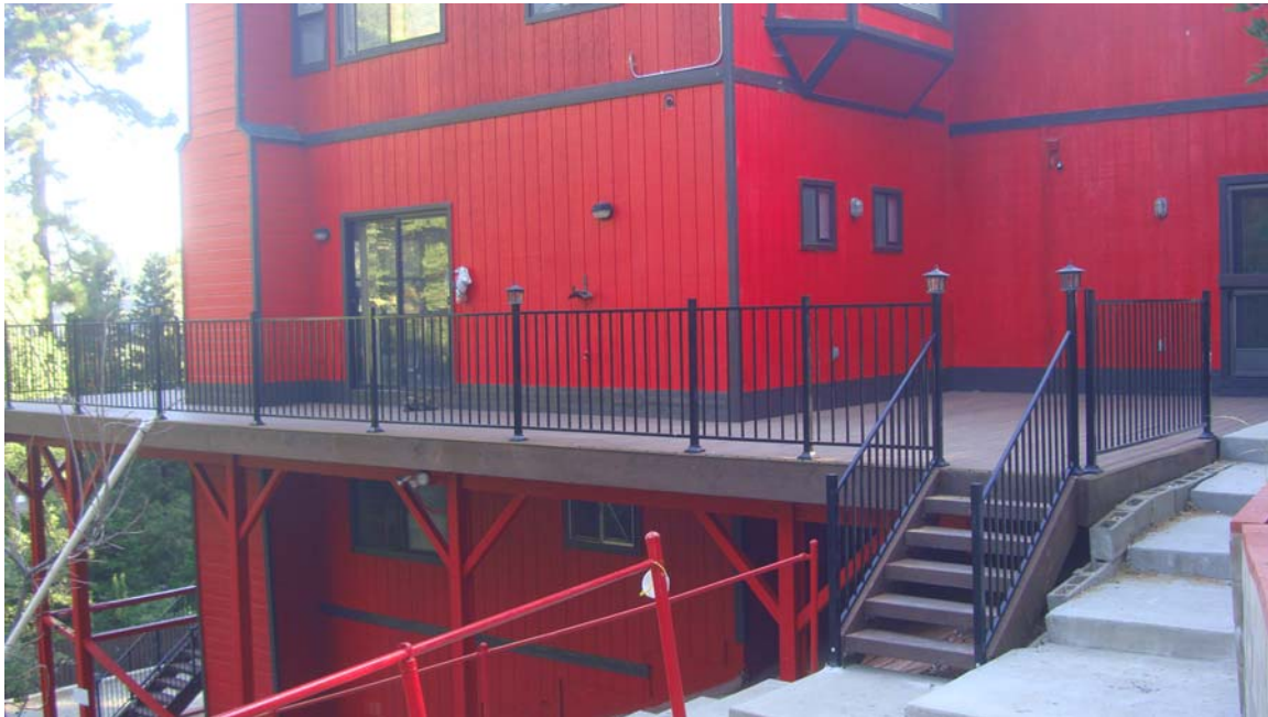
Phía bên hông phải phòng nam