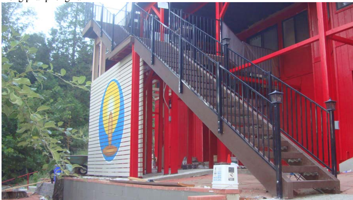
Cầu thang mới và lang cang mới.