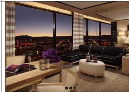
Phòng Khách (trong mỗi phòng ngủ)