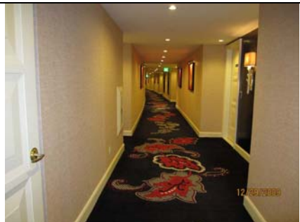
Bên Ngoài Phòng Ngủ